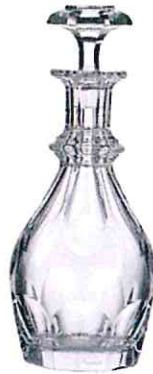
BACCARAT, um 800 €