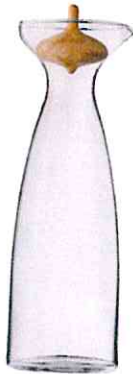
GEORG JENSEN, um 47 €