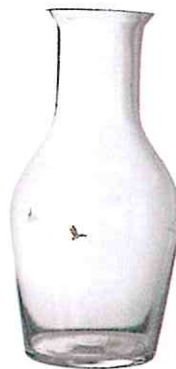
STILLSEGLER, um 88 €