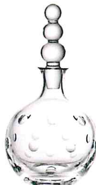
SAINT-LOUIS, um 495 €