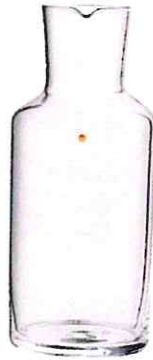
LOBMEYR, um 130 €