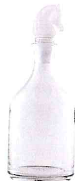
RALPH LAUREN HOME, um 915 €