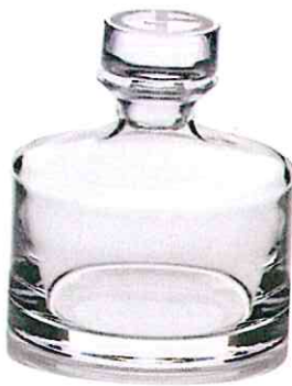
ARMANI CASA, um 180 €

SIE VEREDELN JEDE TAFEL UND GEBEN JEDER FLÜSSIGKEIT EINEN WÜRDIGEN RAHMEN: GLASKARAFFEN VON VERSPIELT BIS SCHLICHT. PROST!