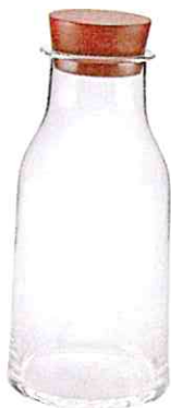
ALESSI, um 46 €