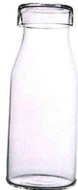
COVO, um 26 €